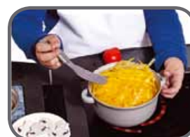
MAKARON Z SOSEM